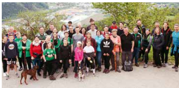
Die Teilnehmer des Familienwandertages

Traditionell veranstalteten die Schützen in der wett-kampffreien Sommerzeit den Familienwandertag. Vom Ausgangspunkt beim Hochofen in Sankt Gertraud marschierte die 39-köpfige Wandergruppe zunächst entlang der Hinterwölcher Gemeindestraße in Richtung vlg. Unterer Steinbauer. Von dort ging es weiter entlang des Erzwanderweges Nr.1 zum Kraftplatz und dem ehemaligen Bergwerkszentrum Hinterwölch mit dem Anton-Stollen und der Barbarakapelle. Danach führte der Wanderweg entlang des Konradkogels vorbei am Benedicti-Stollen und schließlich gelangten die wanderfreudigen Schützen über das Henneck zum Gasthof Kleinhenner. Nach einer zünftigen Jause ging es wieder talwärts durch wunderschöne Waldwege zum Ausgangspunkt in St. Gertraud.